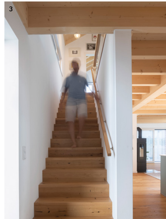
3 VON DER GERÄUMIGEN DIELE führt eine geradläufige Massivholztreppe ins obere Geschoss. Ein breites Fensterband versorgt sie im oberen Bereich mit Tageslicht.